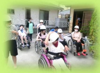
●月に1度の防災訓練